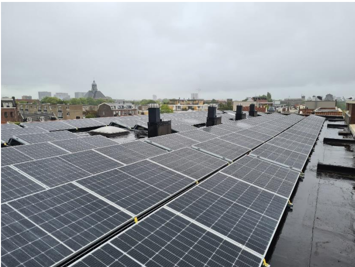
Zonnepanelen Dok 2, met uitzicht op de Oosterkerk

Helemaal rustig op het Entrepotdok was het niet, want afgelopen zomer zijn de zonnepanelen van Dok 2 geplaatst! Het waaide en regende soms flink – zie ook de foto met grijze lucht hieronder. Maar onverstoort gingen de installateurs van Zon & Co door. Daarmee is ons recentste project gerealiseerd, binnen de week van 17 juli.